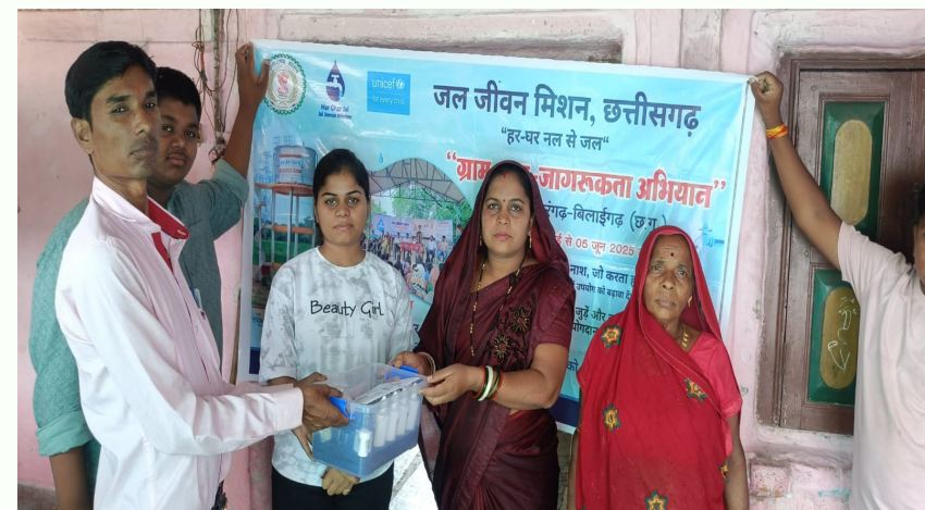
OPPO F25 Pro 5G

सरकारी डाटा तक वास्तविक समय में पहुँच के लिए WQMIS फील्ड यूजर ऐप पर ऑनलाइन प्रविष्टियां