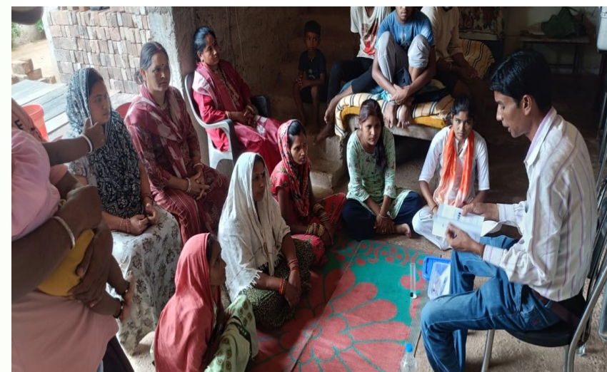
OPPO F25 Pro 5G